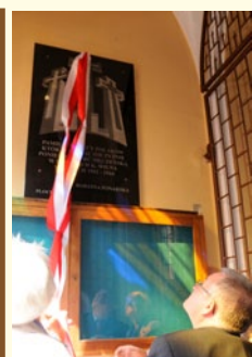
Poświęcenie Tablicy Ponarskiej