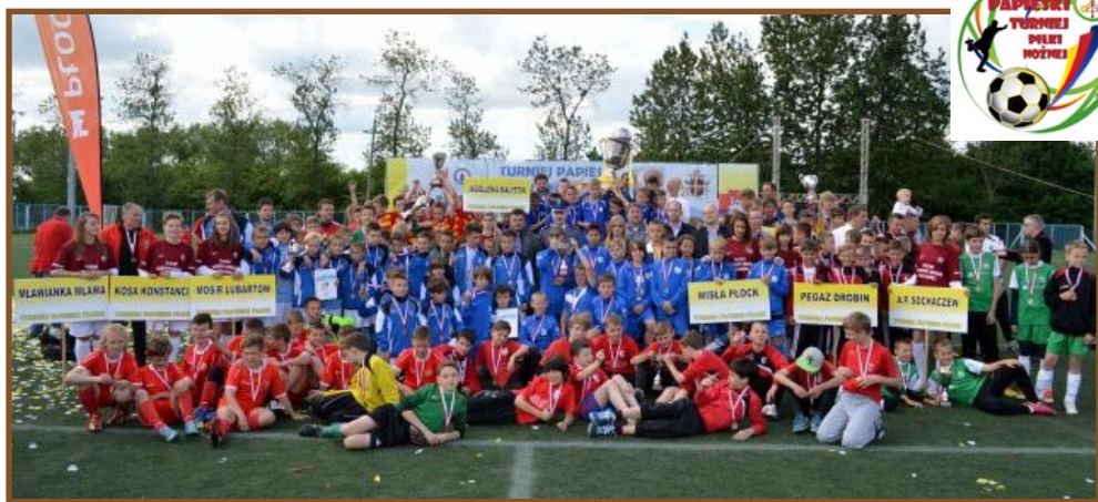
VI Turniej Papieski Piłki Nożnej