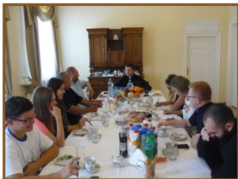
Spotkanie Diecezjalnej Diakonii Ruchu Światło-Życie